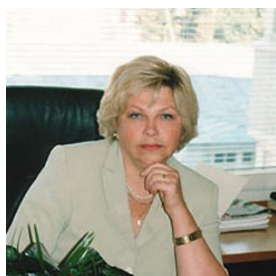
Драпекко Елена Григорьевна Первый заместитель председателя комитета Государственной Думы ФС РФ по культуре