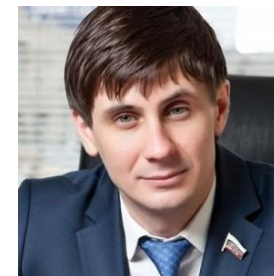
Деньгин Вадим Евгеньевич Первый заместитель председателя комитета Государственной Думы ФС РФ по информационной политике, информационным технологиям и связи