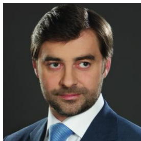
Железняк Сергей Владимирович Председатель Федерального оргкомитета конкурса, Заместитель Председателя Государственной Думы ФС РФ